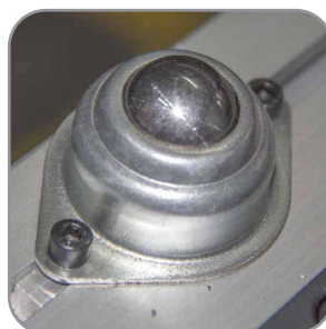
Deslizadores de plancha