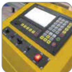
Panel de control Pantalla 7"