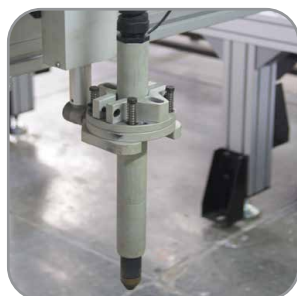
Antorcha Plasma Con control de altura